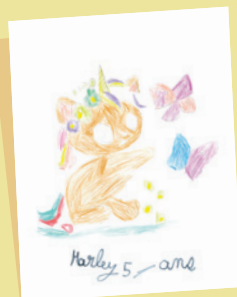
Marley 5 ans

L'Info-Journal Junior est un supplément à L'Info-Journal de la Fondation Brigitte Bardot. Toute revente est interdite. ISSN 1770-4359. Directeur de la publication : Brigitte Bardot - Coordinateur de la rédaction : Bruno Jacquelin - Maquette-photogravure : RectoVerso - Dessins : Studio-B.fr Imprimerie : Imprimerie Nouvelle - Yvetot (76) - Dépôt légal : 2 e trimestre 2025 - Tirage : 46 000 ex. - Crédits photos : Couverture : ©DR @pxhere.com · p.2 : ©FBB ©DR @pxhere.com · p.3-4-5-6, ©DR @pxhere.com · p.7 : ©pxhere.com ©pexels-towfiqu-barbhuiya · p.8 : ©DR.