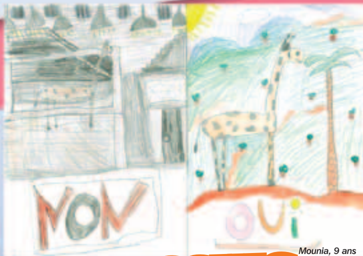
Mounia, 9 ans